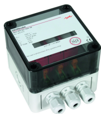
Az ábrák nem kötelező érvényűek