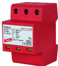
Az ábrák nem kötelező érvényűek