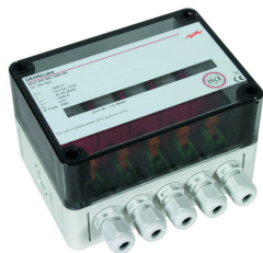
Az ábrák nem kötelező érvényűek