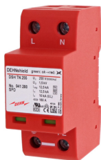
Az ábrák nem kötelező érvényűek